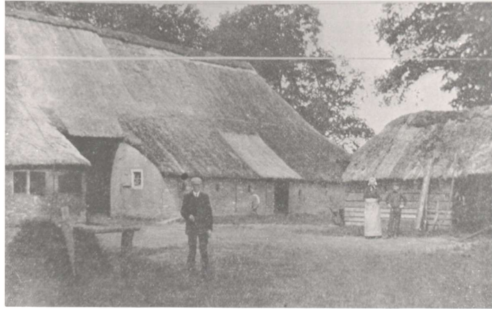
de oude boerderij rond 1915. Jelke de Vries, zijn vrouw en zoon

Het burgerhuis werd gebouwd rond 1959 en is particulier verhuurd.