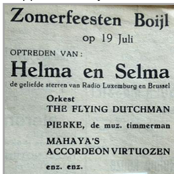
uit Aanpakken 1952